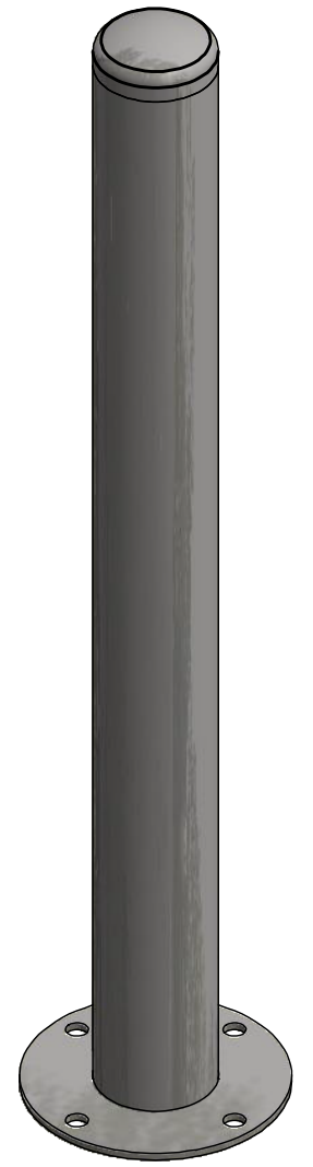
ISO VIEW (1:5)